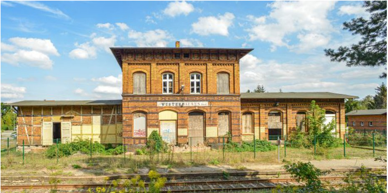
Gebäudeansicht von der Gleisseite