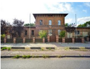
Ansicht von der Straßenseite