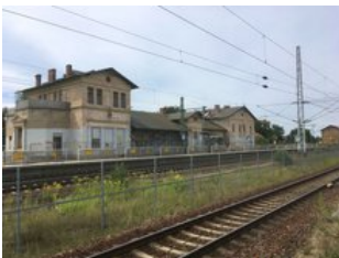
Ansicht von der Gleisseite