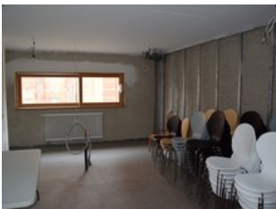
baulich vorbereitete Küche

Einstmals speziell für die Jagdausflüge der preußischen Könige – und späteren Kaiser – gebaut und später als Wohnhaus genutzt, stand der sogenannte Kaiserbahnhof Halbe seit dem Jahr 1994 leer. Durch die fehlende Nutzung und Vandalismus verfiel der Prachtbau im Laufe der Jahre zunehmend, ehe ihn der Neuseeländer Peter Macky im Jahr 2010 kaufte und die denkmalgerechte Sanierung plante und durchführte. Im Jahr 2019 folgte die feierliche Wiedereröffnung.