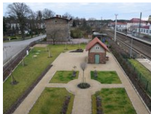
wiederhergestellter, kaiserlicher Garten

Suche nach Pächter für Gastronomie Die Vision von Peter Macky für den Kaiserbahnhof sieht für das Erdgeschoss eine Nutzung als Veranstaltungsort mit angeschlossener Gastronomie vor. Während bereits erste Veranstaltungen wie Trauungen, Hochzeitsfeiern und Tagungen in den Sälen stattfinden, gibt es noch keinen Pächter und Betreiber für die Gastronomie. Ein solcher soll auf diesem Wege gefunden werden. Sollten Sie sich angesprochen fühlen, können Sie Ihr Interesse dem unten benannten Ansprechpartner gegenüber kundtun, der selbstverständlich auch für Rückfragen zur Verfügung steht.