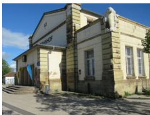
Das derzeitige Gebäude ist dringend sanierungsbedürftig.

Die Baugesellschaft Gotha mbH und die Stadt haben im Januar 2022 ein Interessenbekundungsverfahren gestartet.