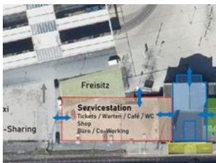
Erste Ideen zum Funktionsplan des neuen Bahnhofs

Der Bahnhof wird von täglich etwa 5.000 Passanten frequentiert; hier halten neben den ICE-Zügen aus Berlin, Leipzig und Frankfurt am Main auch die Regionalzüge nach Erfurt, Halle, Eisenach, Jena und Mühlhausen. Der Bahnhof ist der Verkehrsknotenpunkt für die Stadt und den Landkreis: auf dem Vorplatz verkehren die Straßenbahn- und Buslinien.