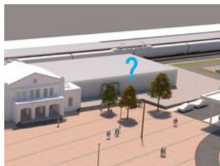
Gesucht werden Nutzungen für beide Gebäudeflügel

Die Baugesellschaft Gotha mbH hat das Gebäude erwerben können. Nun beginnen konkrete Planungen zur Modernisierung. Der neue Bahnhof soll unter Berücksichtigung zukünftiger Nutzer gestaltet werden - gesucht werden daher engagierte Projektpartner und Mieter aus den Bereichen Einzelhandel und Dienstleistungen, Gastronomie und Reiseservice, Tourismus, Raddienleistungen und ähnliche Branchen. Der Bahnhof soll wieder zu einem Aushängeschild der Stadt und ein attraktiver Ort für Pendler, Reisende und die vielen Touristen.