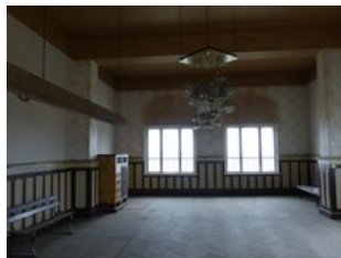
Beispiel Innenraum (ehemalige Gaststätte)