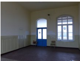
Beispiel Innenraum (ehemalige Wartehalle)