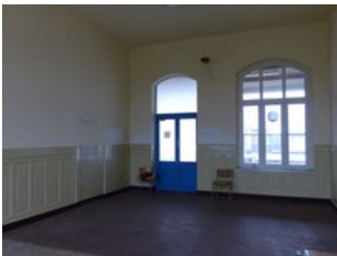
Beispiel Innenraum (ehemalige Wartehalle)