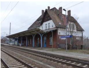
Ansicht von der oberen Bahnsteigseite