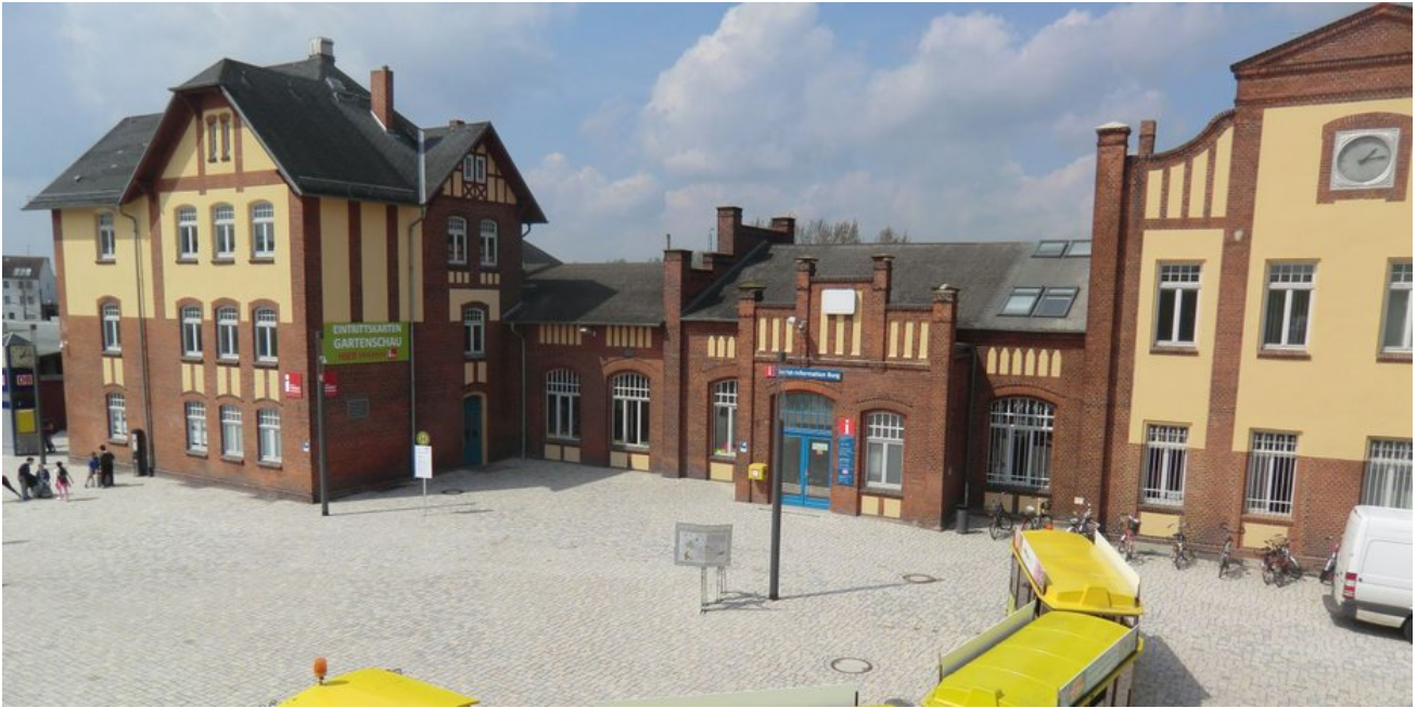
Der Burger Bahnhof wurde 2018 zur Landesgartenschau modernisiert.