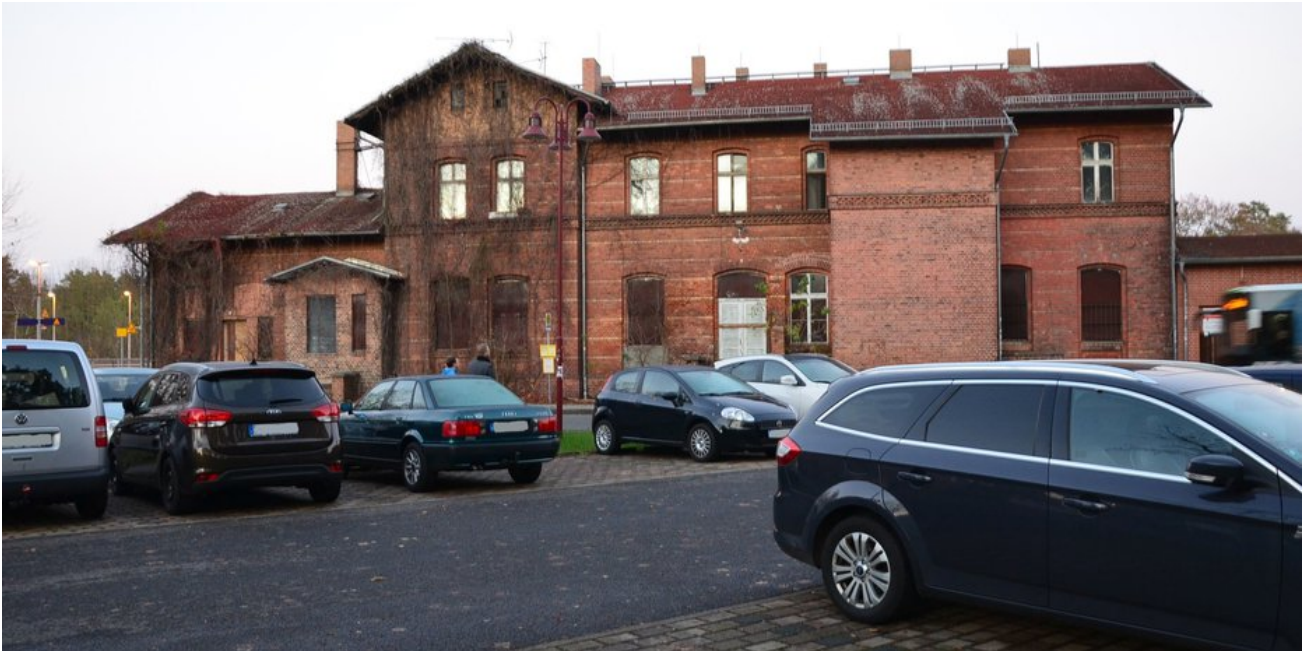
Das Bahnhofsgebäude von der Straßenseite