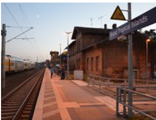
Das Bahnhofsgebäude von der Gleisseite