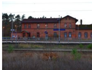
Gesamtansicht des Bahnhofsgebäudes von der Gleisseite

Das Bahnhofsgebäude von Brand – Tropical Islands befindet sich im Eigentum der Gemeinde Halbe, die Nutzungsideen und Mieter für diese Immobilie sucht.