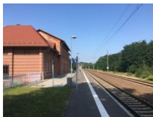
Gebäudeansicht von der Gleisseite