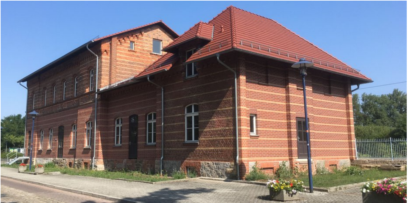
Gebäudeansicht von der Straßenseite