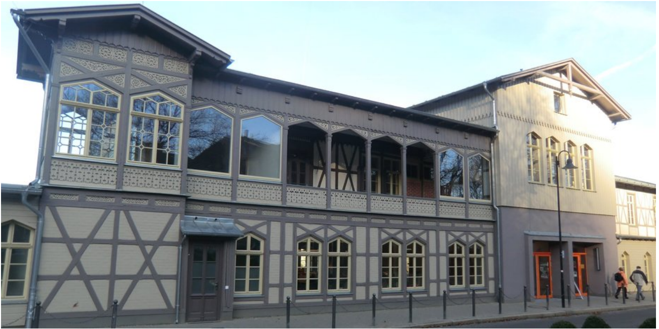
Schmuckstück im Ortszentrum