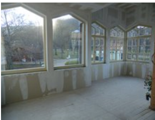
Freie Mieteinheiten im Obergeschoss