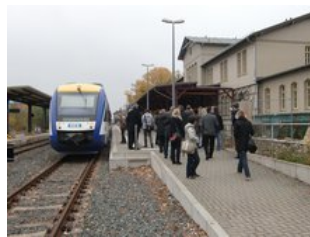
Aus dem Zug in den Bahnhof