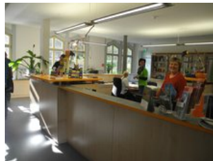
... mit Bodetal-Tourismusinformation