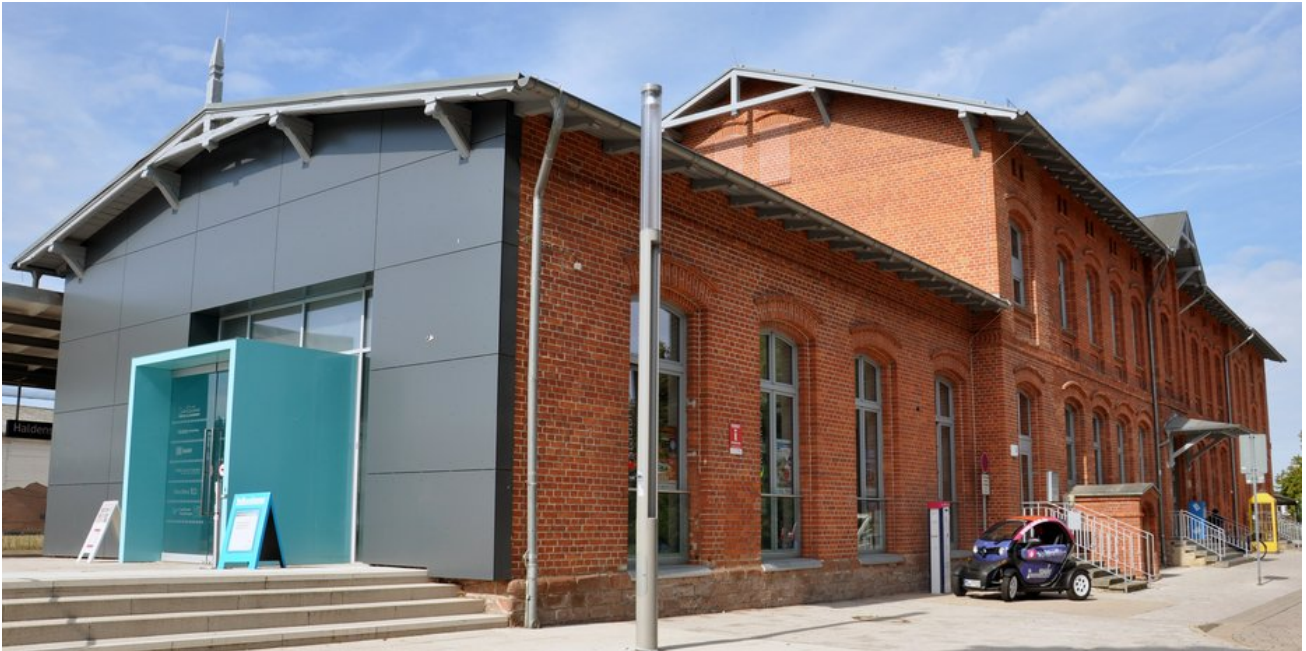
Sanierter Bahnhof mit neuem Zugang